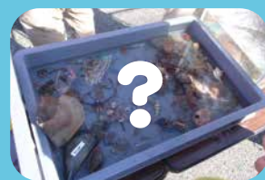
漁くずに何が 入っているかな?