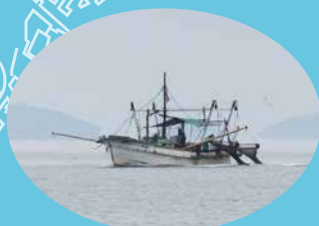
底びき網漁業 (石ゲタ網)

底びき網漁の網に混じって入ってくるもの(漁くず)をみんなで しらべてみよう! 普段なかなか見られない大阪湾の海底にすむ フシギな生きものに出会えるよ! ※漁船には乗りません。漁港での体験になります。