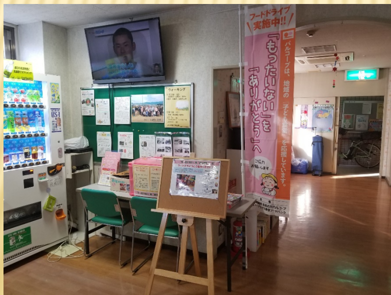
きづがわ医 療福祉生協