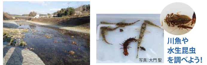
川魚や水生昆虫を調べよう!

石川にどんな生きものがすんでいるのか、専門家と一緒に川へ入って調べてみよう! 木根館(きんこんかん)で木の工作もして、思い出と一緒に持って帰ろう。