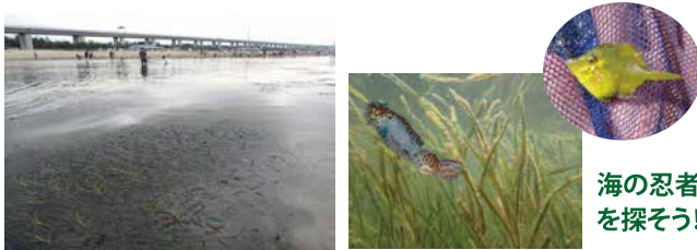
海の忍者たちを探そう!

二色の浜でダイバーさんと一緒にシュノーケルに挑戦だ! 海の草原「アマモ場」に暮らす生きものを探してみよう。見つけた生きものは自然遊学館で詳しく調べよう。