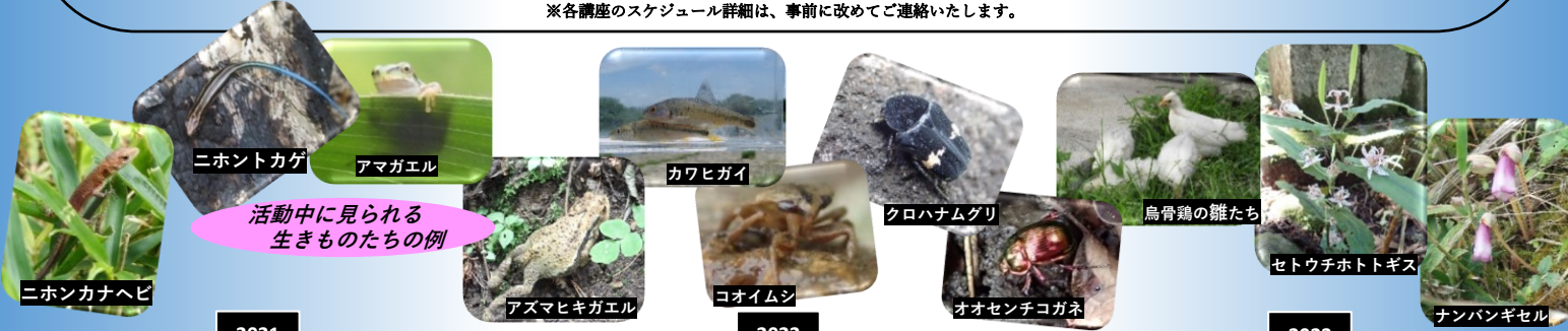
ニホンカナヘビ ニホントカゲ アマガエル