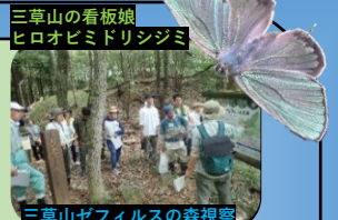
三草山の看板娘 ヒロオビミドリシジミ