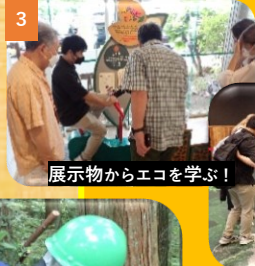
展示物からエコを学ぶ!