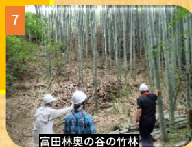
富田林奥の谷の竹林