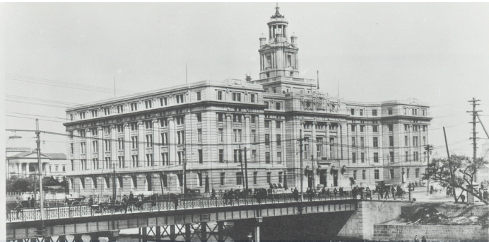
大阪市立図書館ホームページ（1921年大阪市府舎）