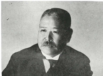
大阪市長就任時の池上四郎【元大阪市長池上四郎君照影】