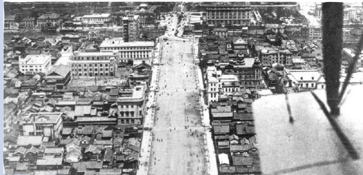
大阪市立図書館ホームページ（1929年御堂筋）